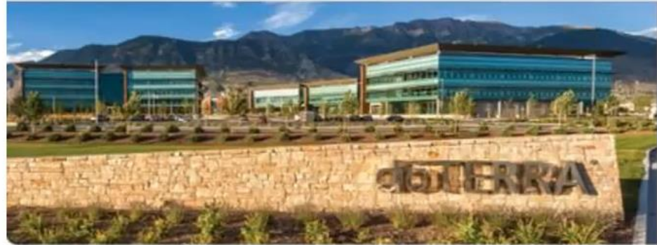
dōTERRA Headquarter in Pleasant Grove, Utah